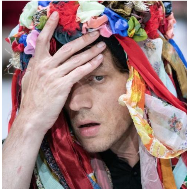
▲ Inscenácia Sad Sam Matúš (Chorvátsko, Slovinsko) otvorí festival.