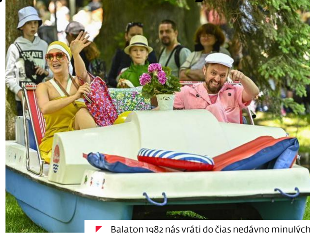
▲ Balaton 1982 nás vráti do čias nedávno minulých.