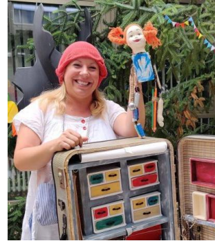
▲ Divadelná Nitra 2022 poteší aj detského diváka.