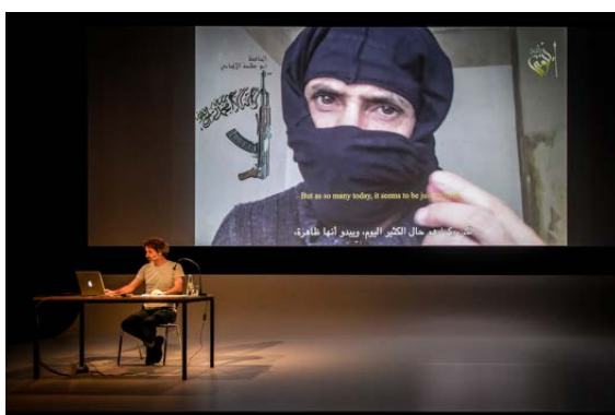
Piesok v očiach