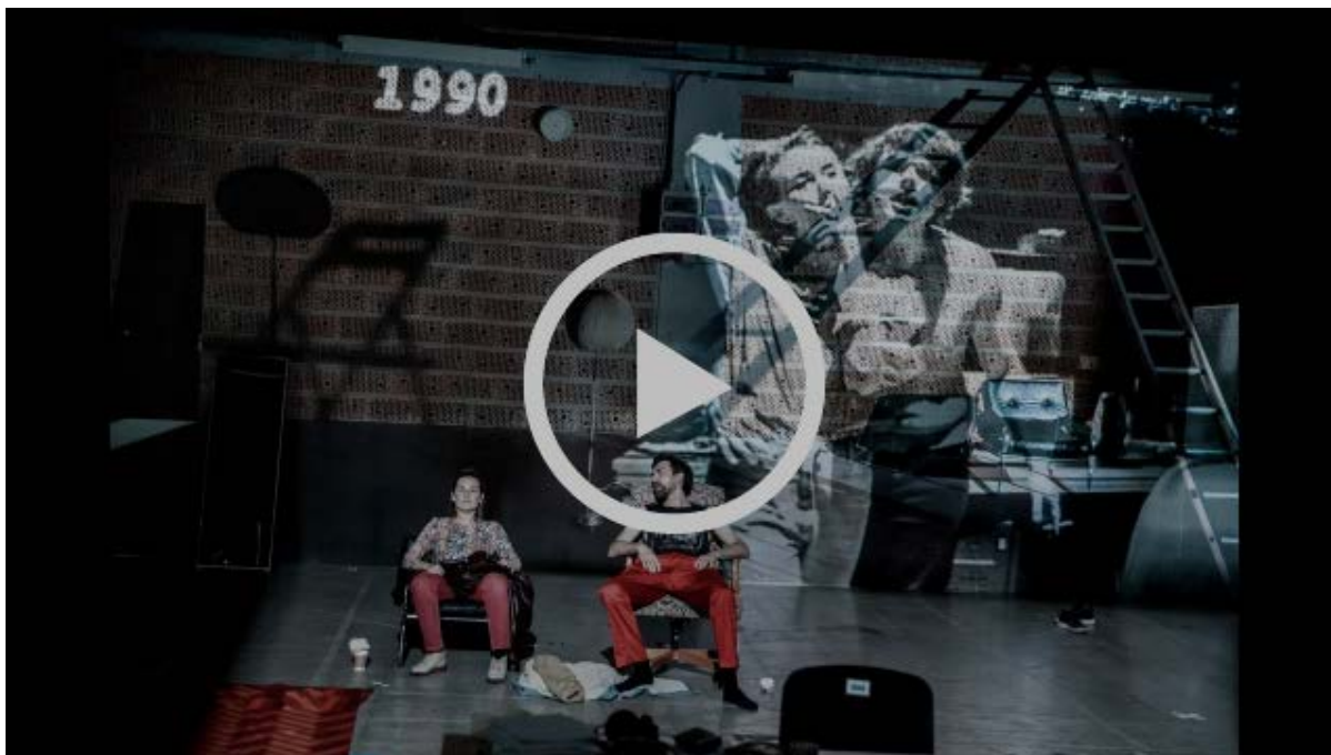
Trailer - Môj boj