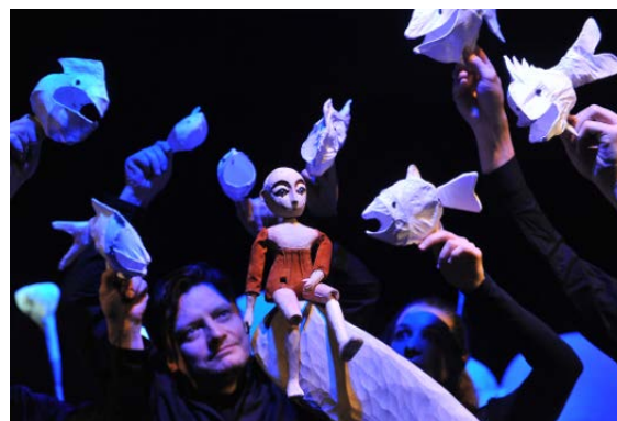
Čechy ležia pri mori

Naivní divadlo Liberec uvedie inscenáciu Čechy ležia pri mori . Netradičné bábkové divadlo v réžii Michaely Homolovej sa odohráva v polotme morského sveta, diváci – a nielen tí detskí, ktorým je dielo v prvom rade určené, sú počas výtvarne mimoriadne pôsobivého predstavenia prakticky súčasťou scény, ktorou je celá divadelná sála. Tu sa odohrá zázrak spojenia nevšednej poézie, obrazu a hudby.